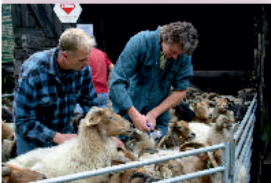
Enting tegen Q-koorts