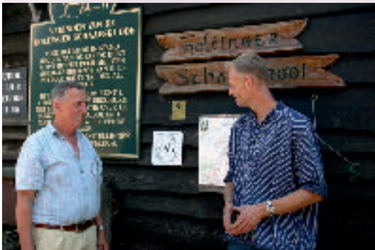
Erkend fokcentrum Drents Heideschaap