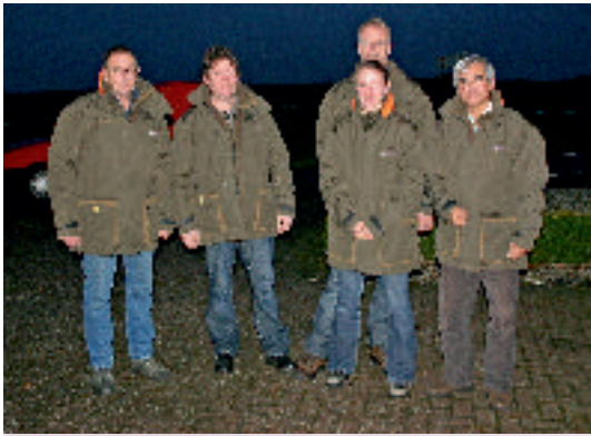
Nieuwe jassen voor de herders